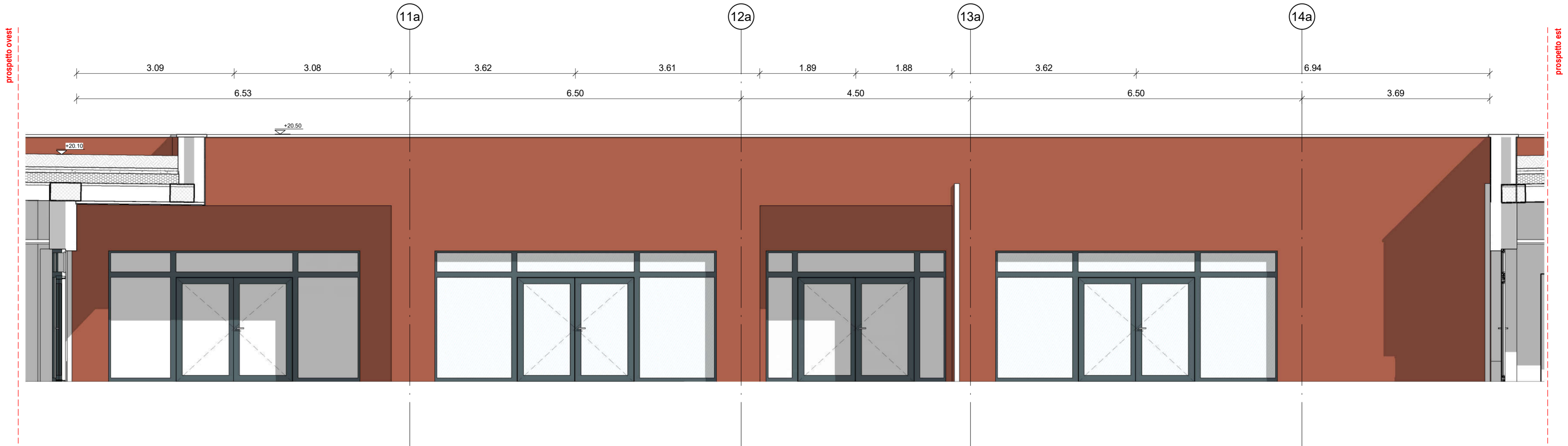
Prospetto Sud corte interna