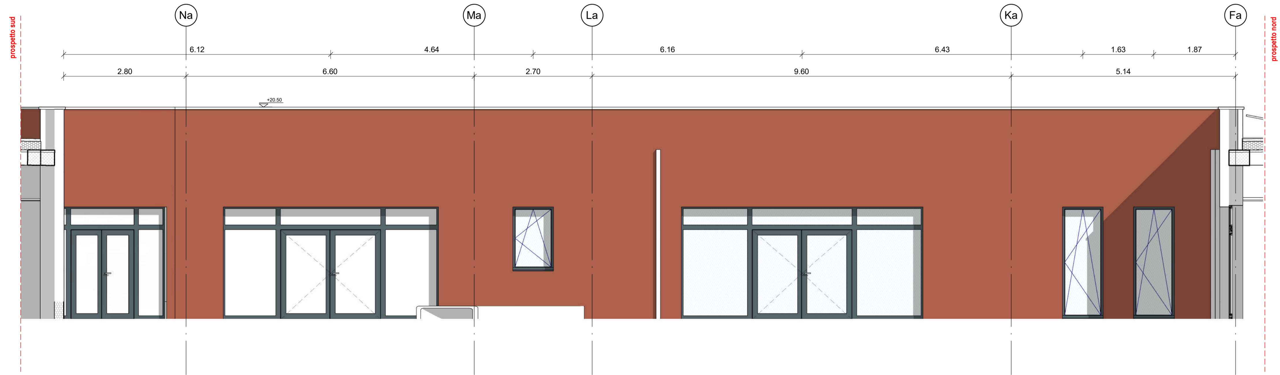
Prospetto Est corte interna