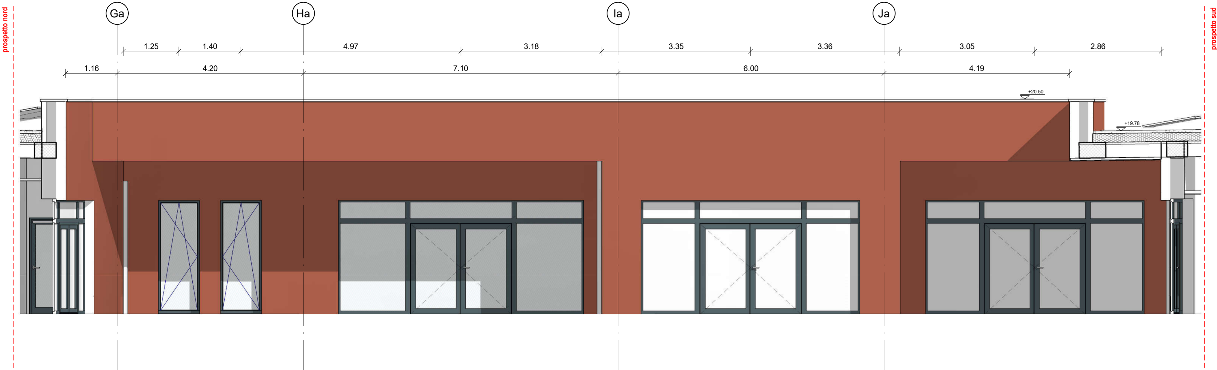
Prospetto corte interna - Ovest