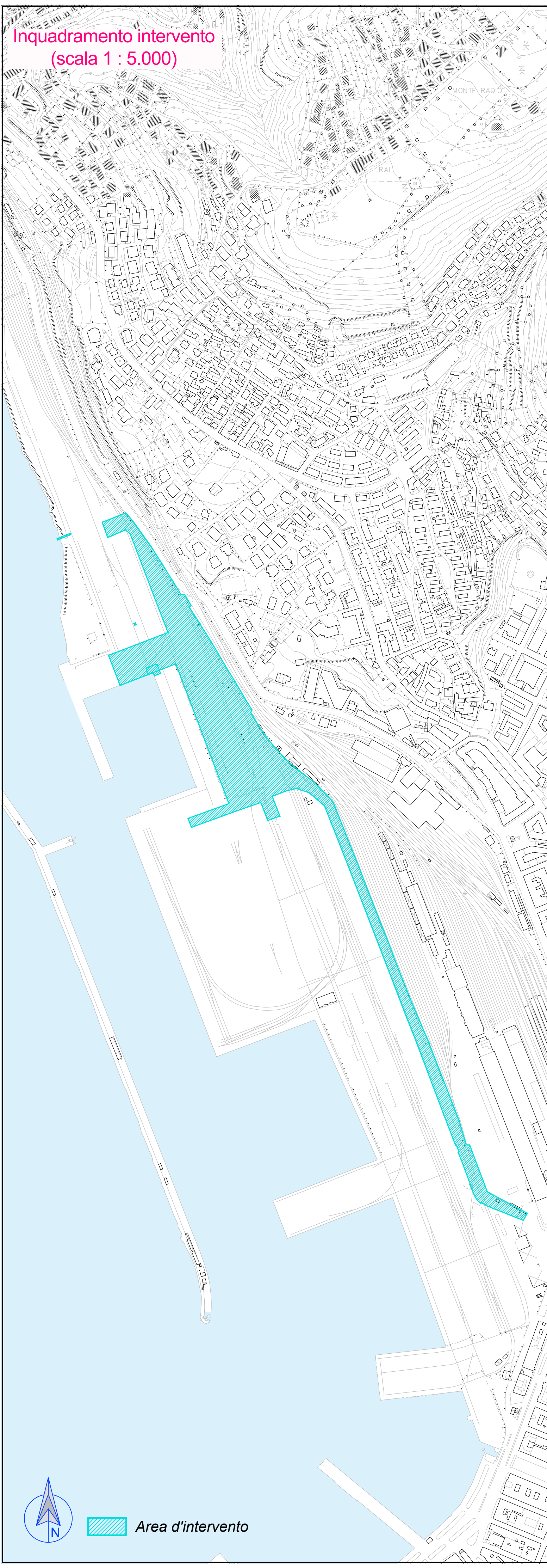
Inquadramento intervento (scala 1 : 5.000)