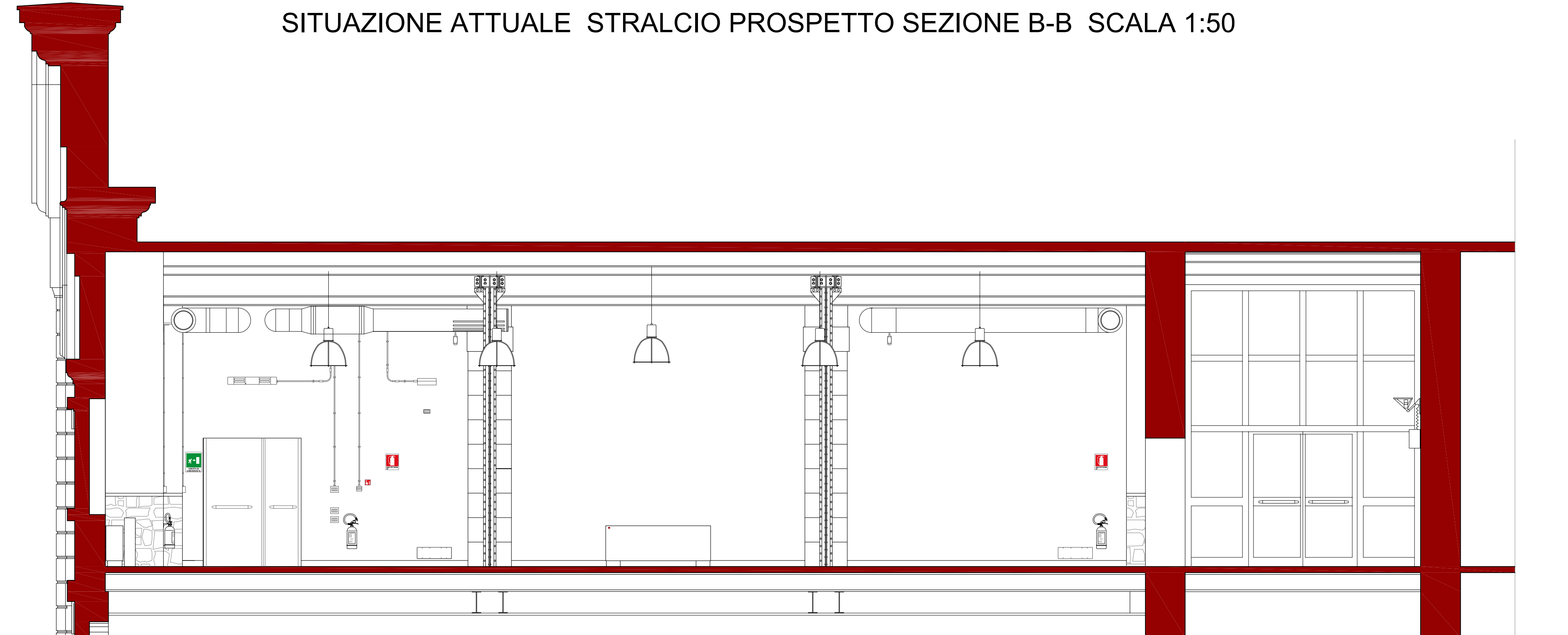
SITUAZIONE ATTUALE STRALCIO PROSPETTO SEZIONE B-B SCALA 1:50