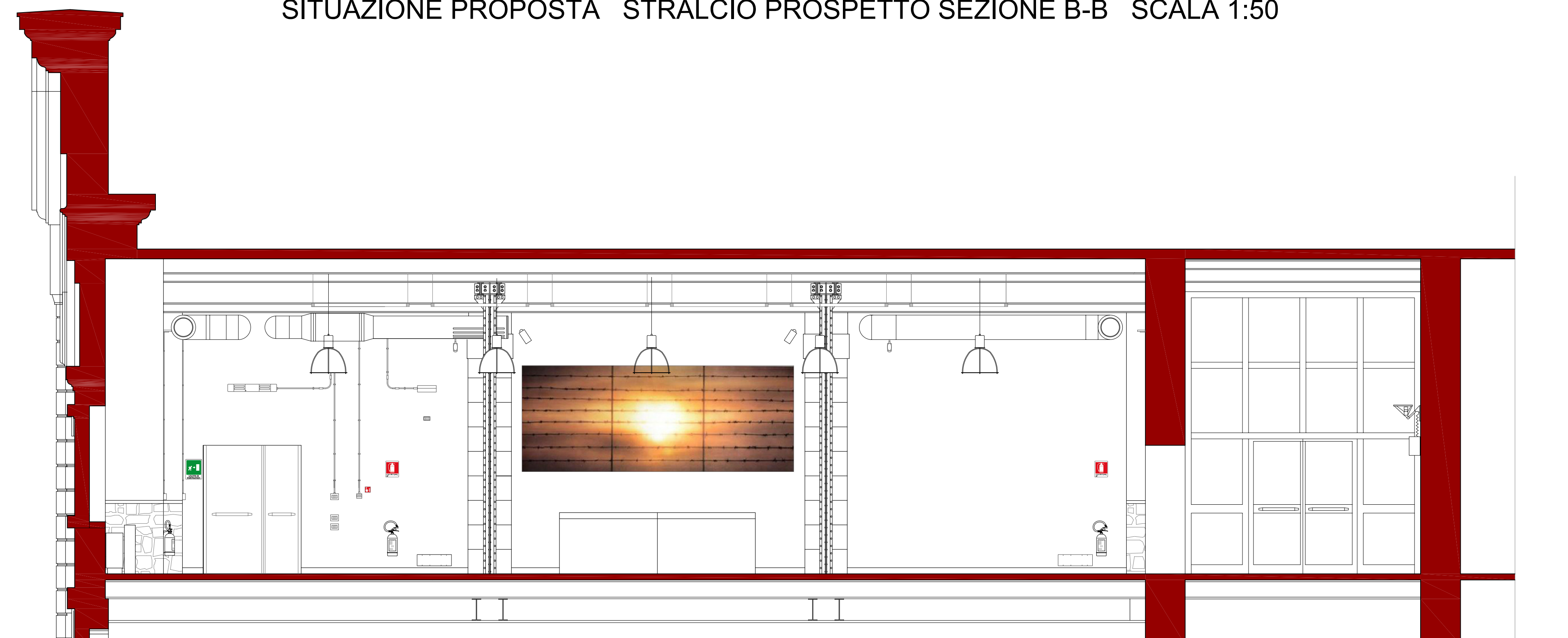
SITUAZIONE PROPOSTA STRALCIO PROSPETTO SEZIONE B-B SCALA 1:50