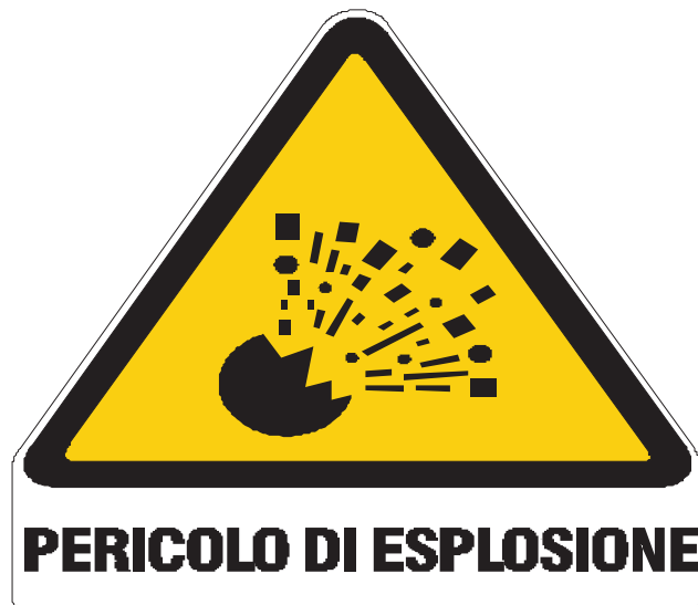
Nome: pericolo esplosione Posizione: deposito