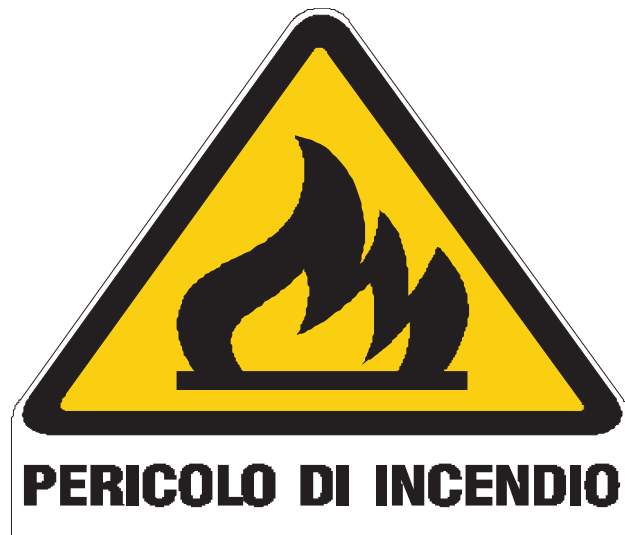
Nome: pericolo incendio Posizione: deposito