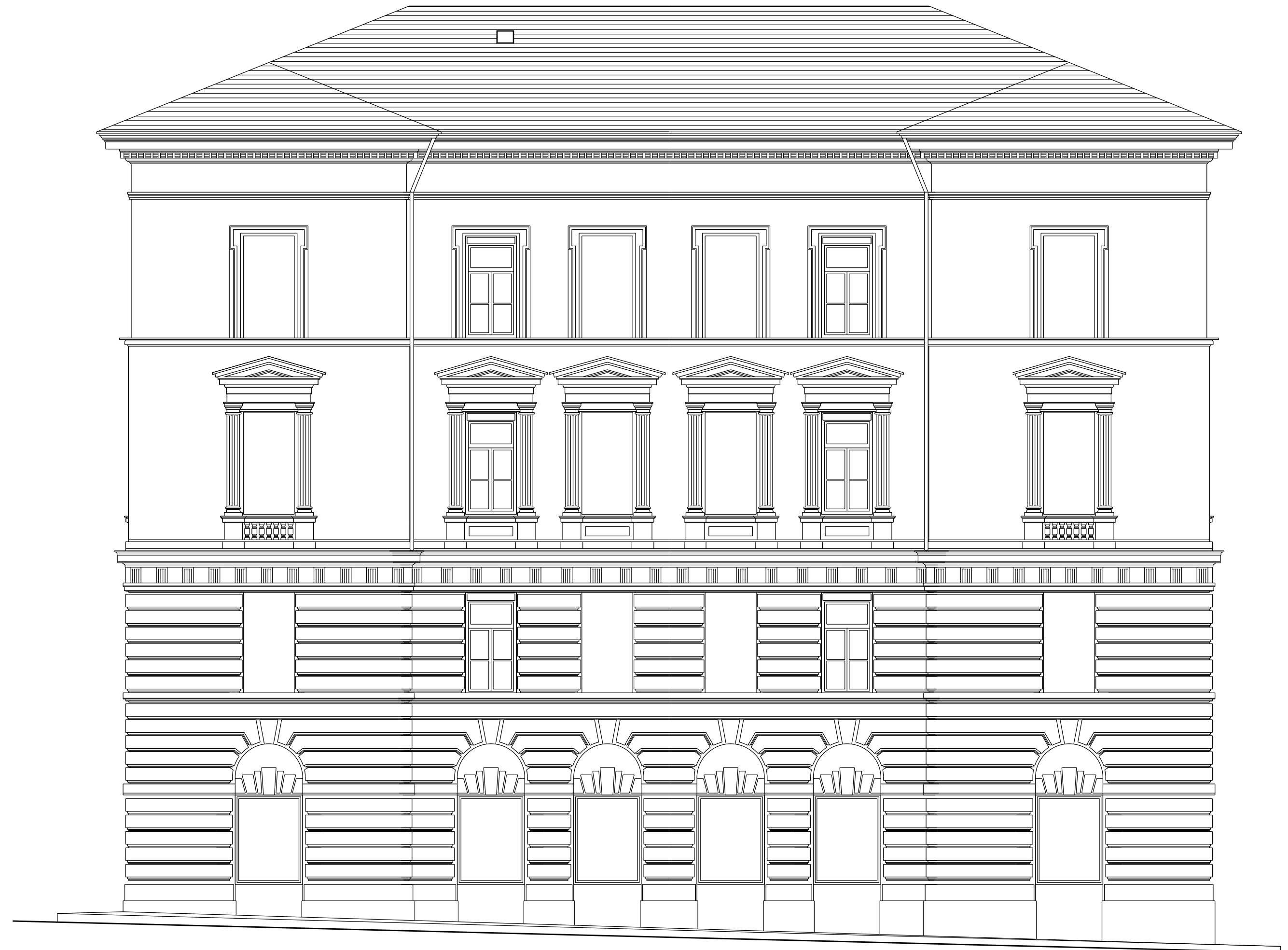
PROSPETTO SU VIA TOR BANDENA